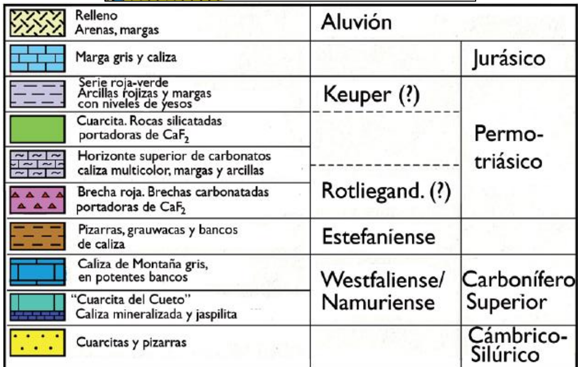
Mapa geológico de detalle del sector de Berbes (Luque et al, 2010).